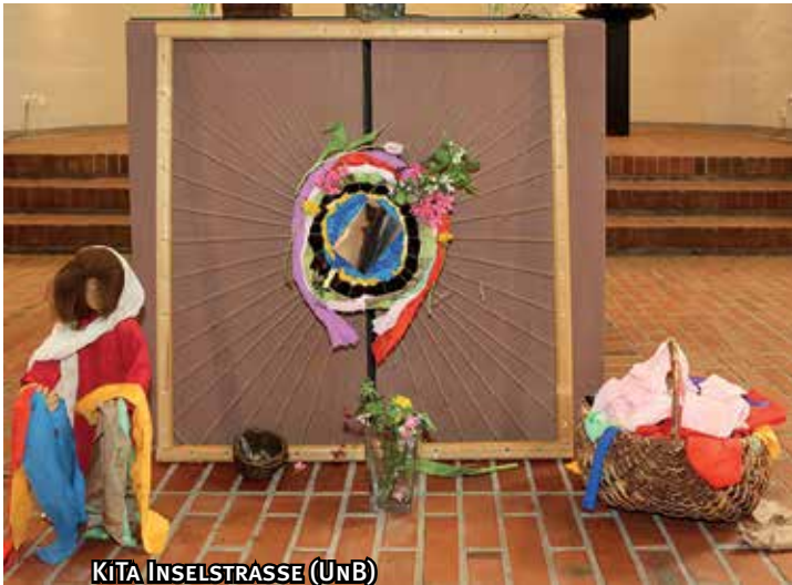
KiTA INSELSTRASSE (UNB)

„Liebe Sonne, liebe Sonne, gelb bist du, gelb bist du. Schönen guten Morgen, schönen guten Morgen, rufen wir dir zu, rufen wir dir zu.“