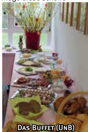
DAS BUFFET (UNB)

Tradition weiterleben und beim nächsten Osterfest noch mehr Menschen zum Osterfrühstück locken.